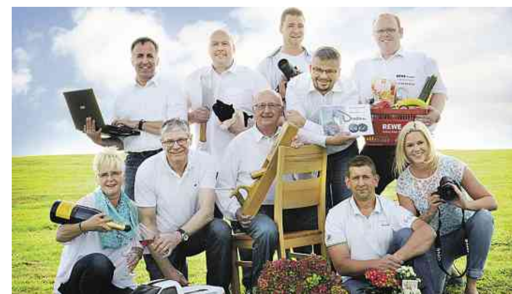
Der Vorstand des Aktionskreises Daaden im Jahr 2015.